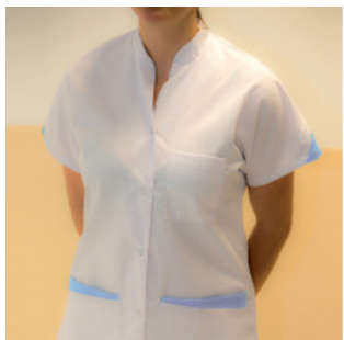
Addetti ai servizi ospedalieri