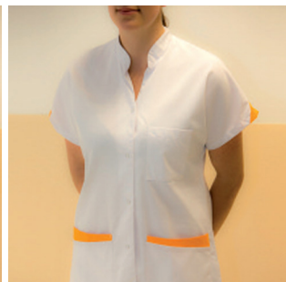
Manipolatori in radiologia medica